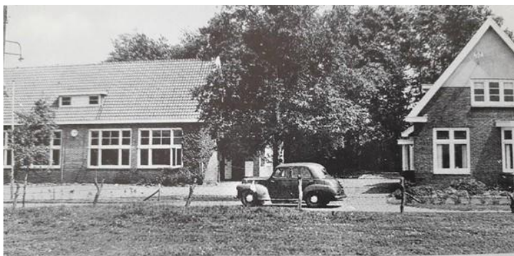
Lagere school en meesterswoning aan de Oudemolenseweg

Ging mijn vader nog in Anloo naar de lagere school, mijn broers en ik konden naar de in 1930 geopende lagere school in Gasteren. Dat was toch iedere dag vier kilometer op klompen lopen. Want tussen de middag moest je naar huis om warm te eten. Om halftwee begon de school weer.