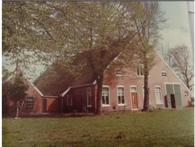
Boerderij De Volharding – Oosteinde 21

Dit is een verhaal opgetekend door Roelof Bonder. Delen daarvan zijn eerder verschenen op de website van historischgasteren@ingasteren.nl of gepresenteerd in De Huiskamer van Gasteren. In deze versie is alles samengebracht tot één geheel m.m.v. H. Roepman van Historisch Gasteren.