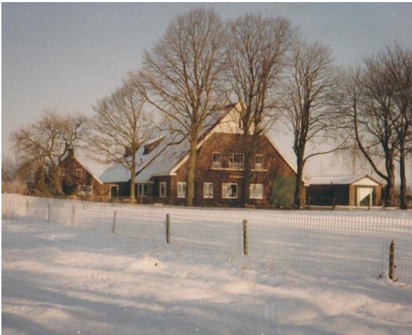
Boerderij De Koningskuil – Oosteinde 19