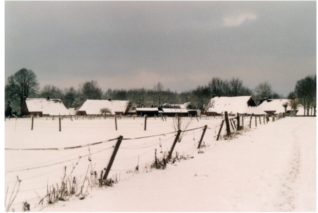
foto: zuides in de winter

De akkers werden aanvankelijk bewerkt met een eergetouw, een hartvormige haakploeg. Voortgetrokken door runderen konden hiermee slechts ondiepe voren worden getrokken en alleen grond aan de oppervlakte worden verkruid. Later ging men over op de dieper insnijdende keerploeg, waarmee ook zwaardere gronden konden worden bewerkt. Langzaam maar zeker werden de bossen op de Zuides gerooid en gereed gemaakt voor akkerbouw.